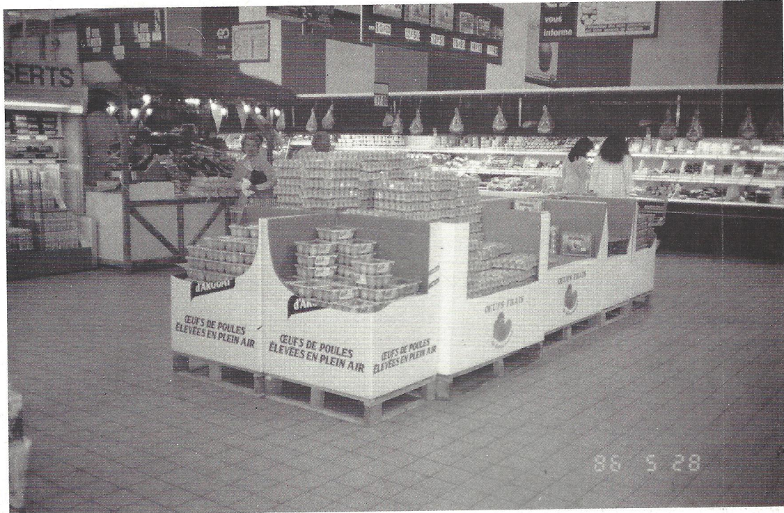
A tendência mundial na distribuição para os supermercados é o palete acompanhar a mercadoria desde o fornecedor até o ponto-de-venda

to de partida poderia ser o uso de veículos com menor capacidade de carga, velocidade média alta e dimensões reduzidas, para permitir deslocamento ágil. Veículos, por exemplo, como Kombi, Fiorino, Mini Van e a caminhonete F 1000.