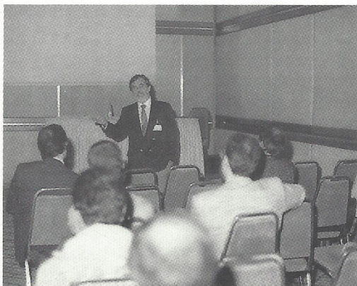
Vianna: política tarifária